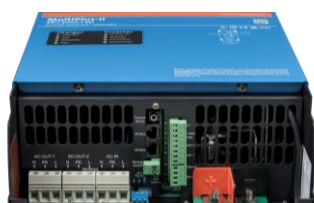
Zone de connexion MultiPlus-II 3k